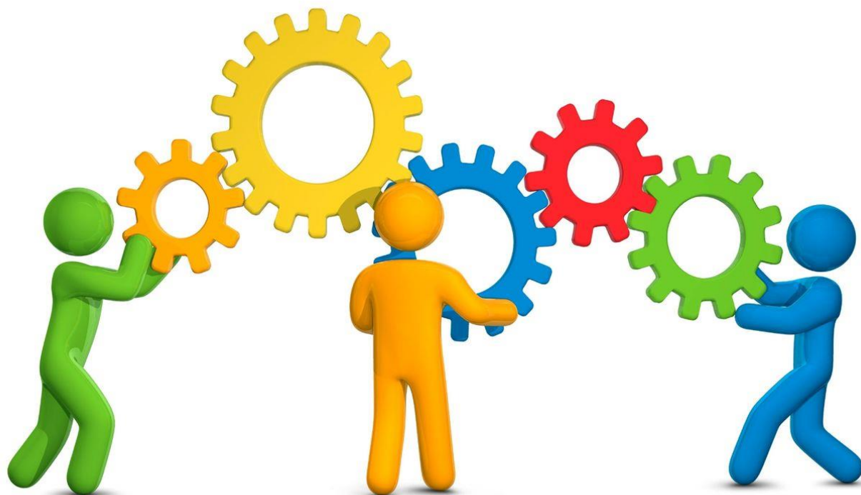
Иллюстрация к занятию «Сотрудничество или учимся работать вместе»